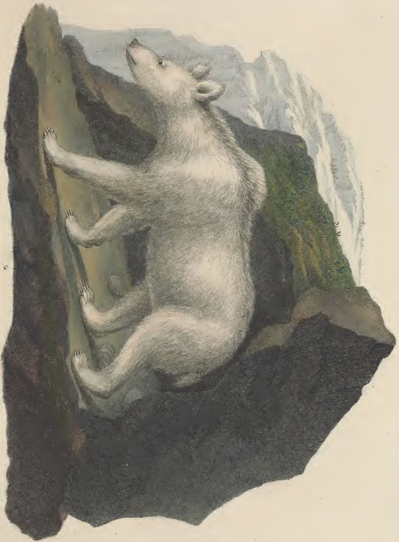
URSUS sibiricus. Linnæus.