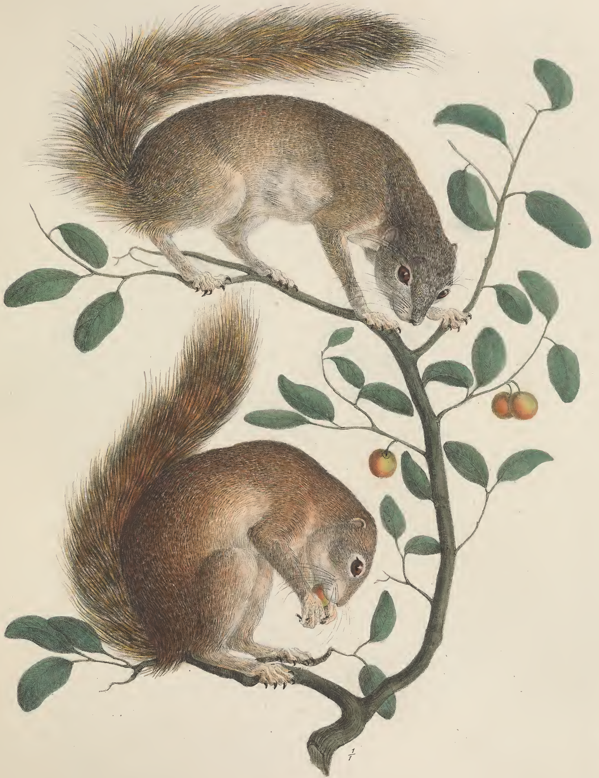
SCIURUS * brachyotus Habessinica.