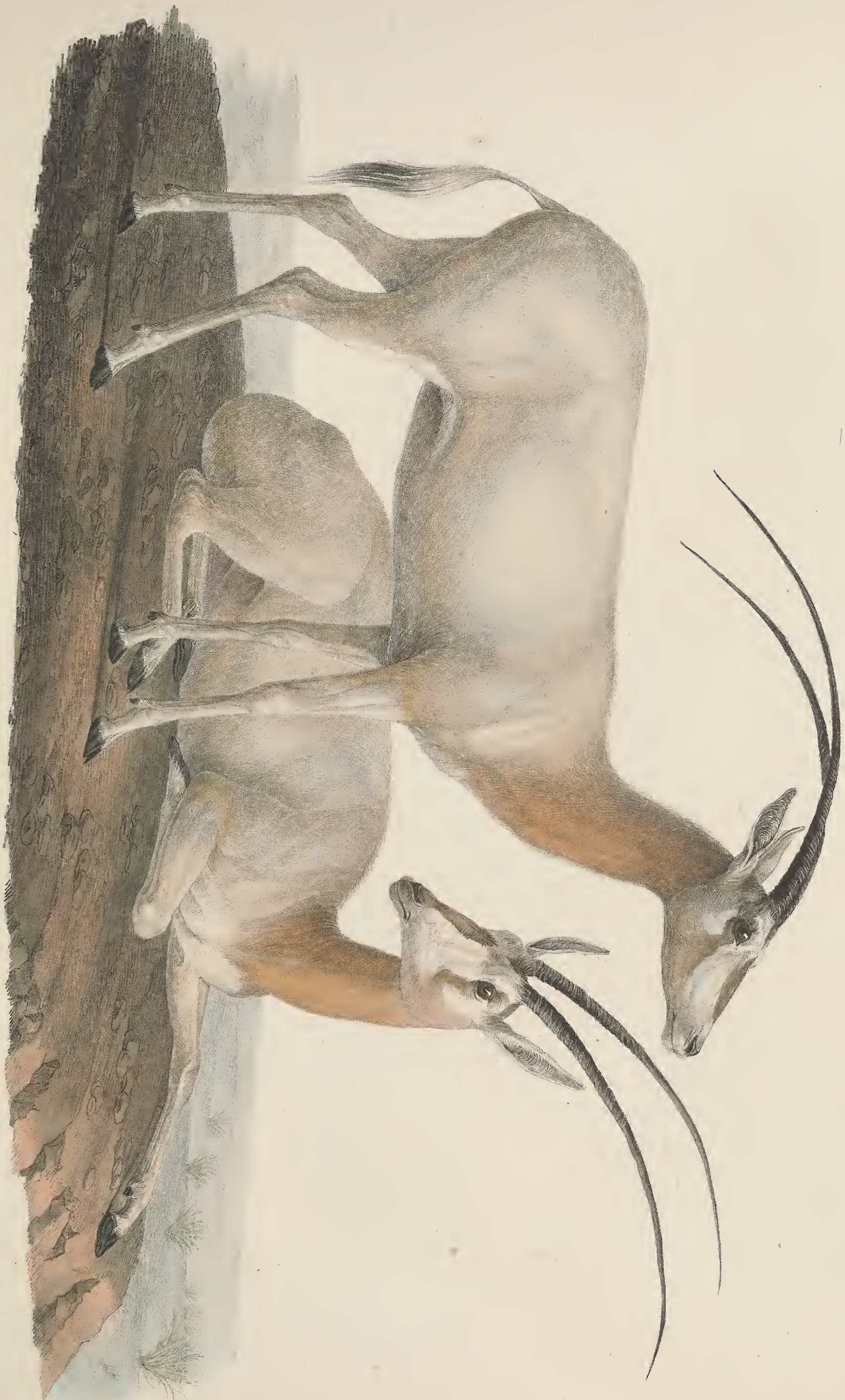
ANTILOPÆ 76. leucocorys femina . Dorcas .