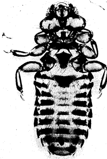
Abb. 3. Myrsidea a. australiensis n. sp. et ssp. ♀ Holotypus, ventral.

Diese Unterart stimmt in allen charakteristischen Merkmalen mit der Nominatform weitgehend überein. Sie unterscheidet sich jedoch von ihr durch die Körpermaße (♂ und ♀) und die abdominale Beborstung, vor allem in der signifikant geringeren Anzahl der pleuralen Setae (♂ und ♀). Weitere statistische gesicherte Unterschiede sind aus Tab. 5 zu ersehen.